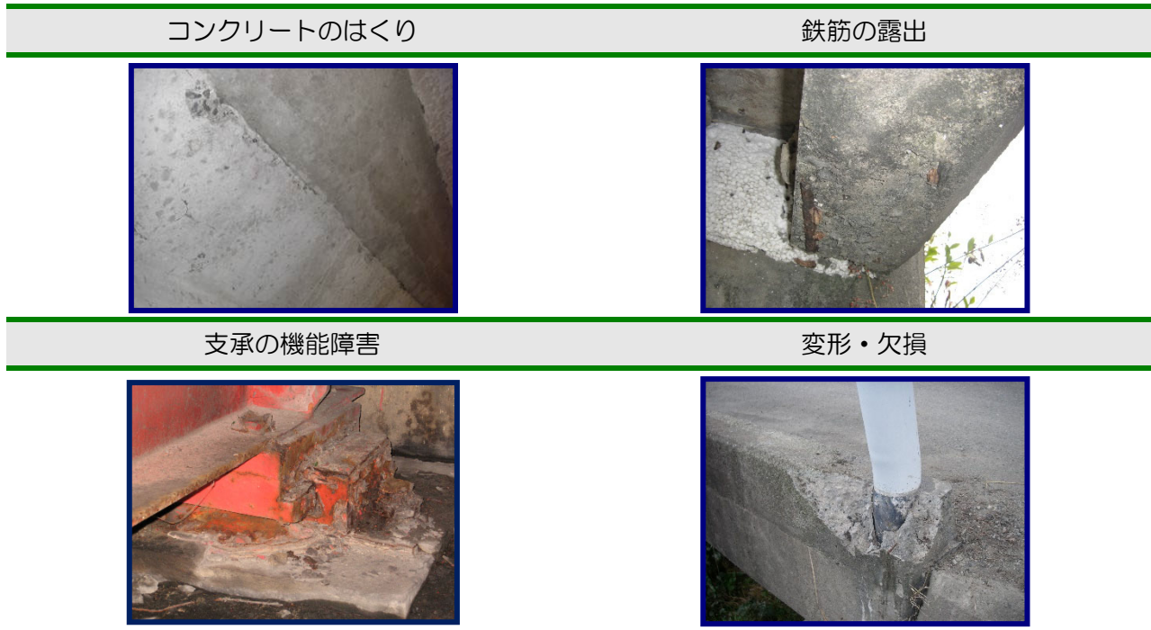
図 1 橋梁の主な損傷例

策定した計画に基づき橋の塗装の塗替えや傷んだ箇所の補修などを計画的に順次実施します。